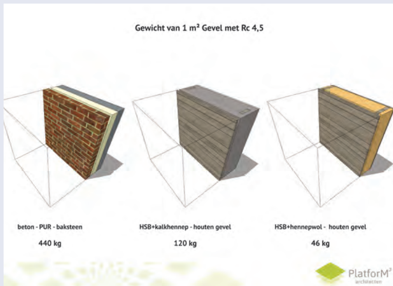
Licht bouwen met hout en hennep.