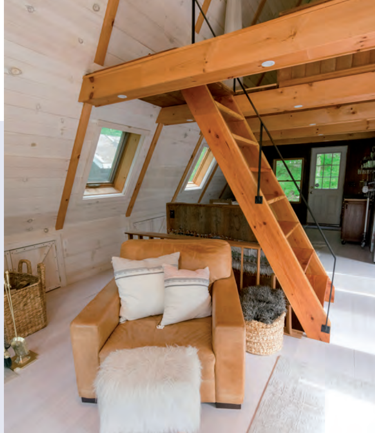
Met biobased bouwen los je oneindig veel op.

Onze rol is om het zichtbaar te maken en te organiseren dat het op alle overheidsniveaus gaat gebeuren. Om de markt te maken, de boel op te schudden en te zorgen dat financiers en overheden hierin stappen.”